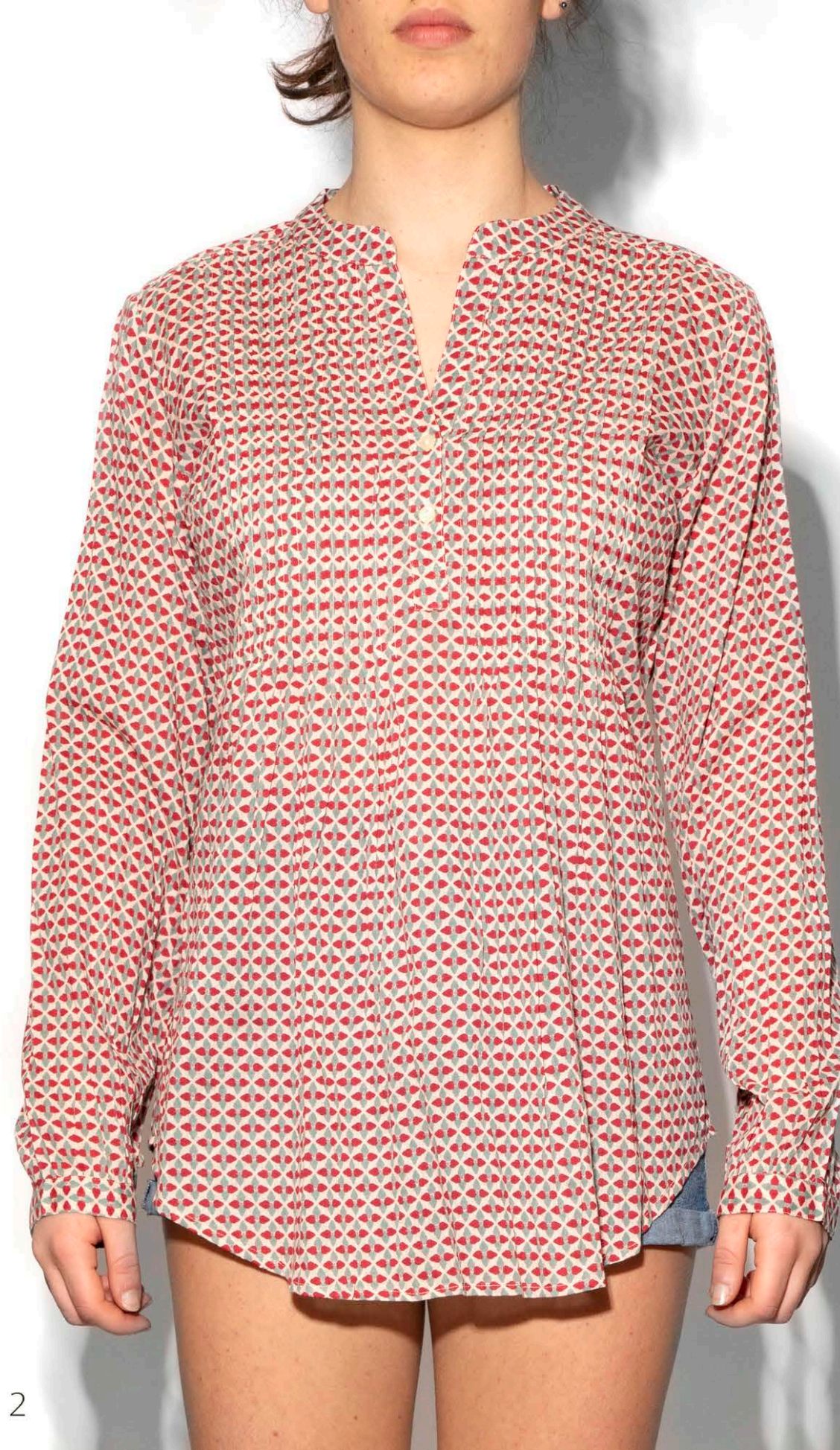
S 302 Kurta Fiore - 100% Cotone - s-m-l-xl