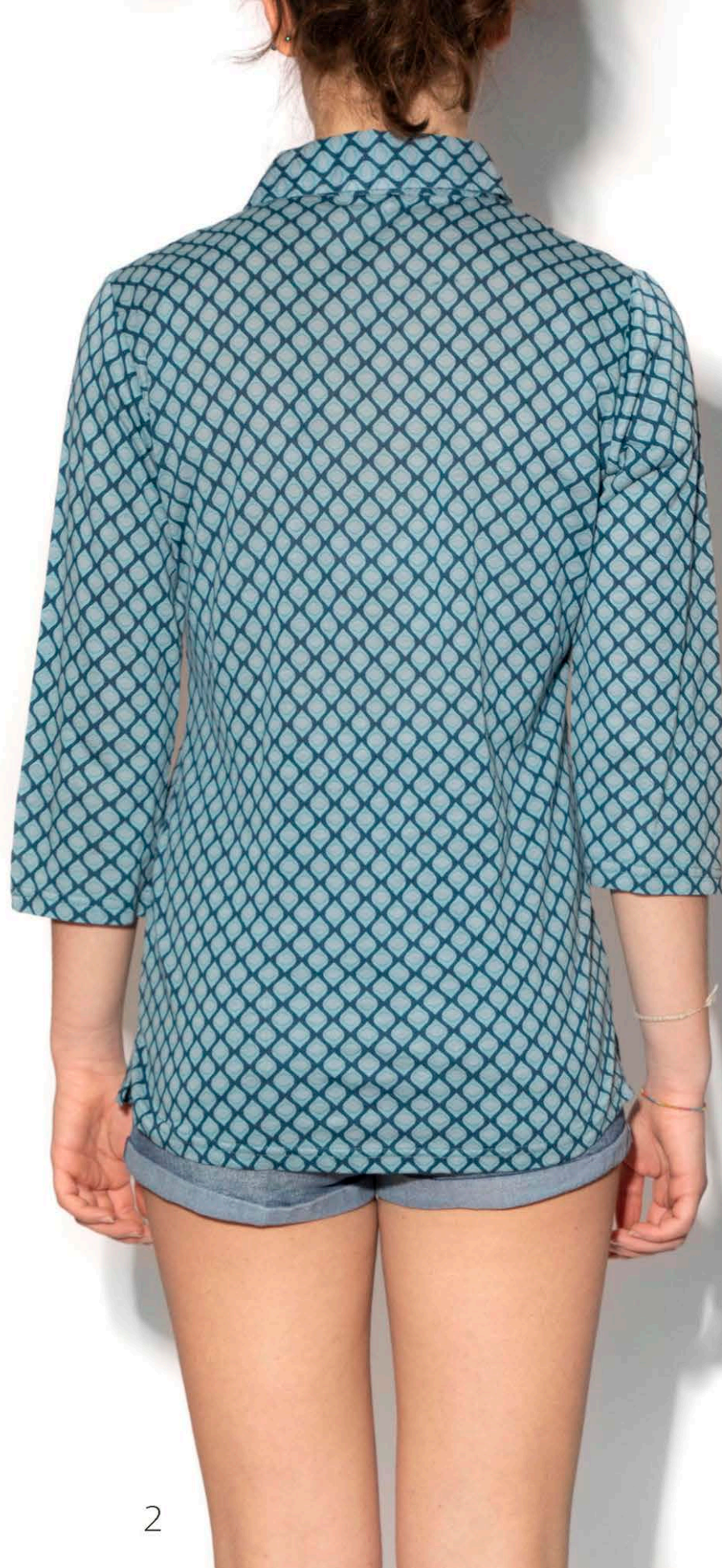
S 335 Camicia Jersey Rombi - 100% Cotone - s-m-l-xl