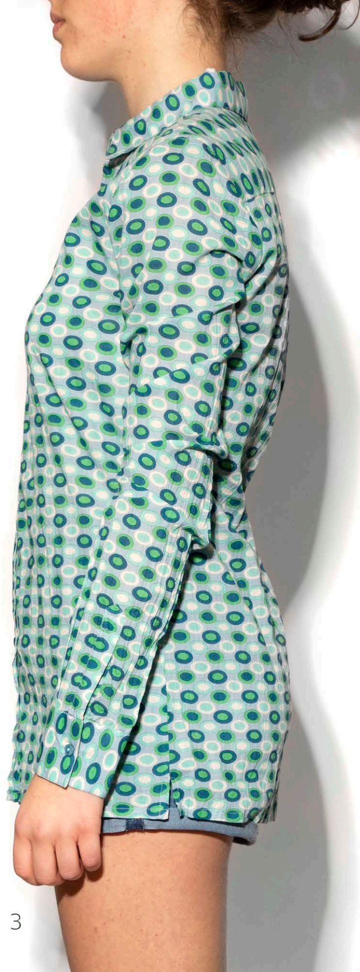
S 11 Slim Shirt Ovali - 100% Cotone s-m-l-xl