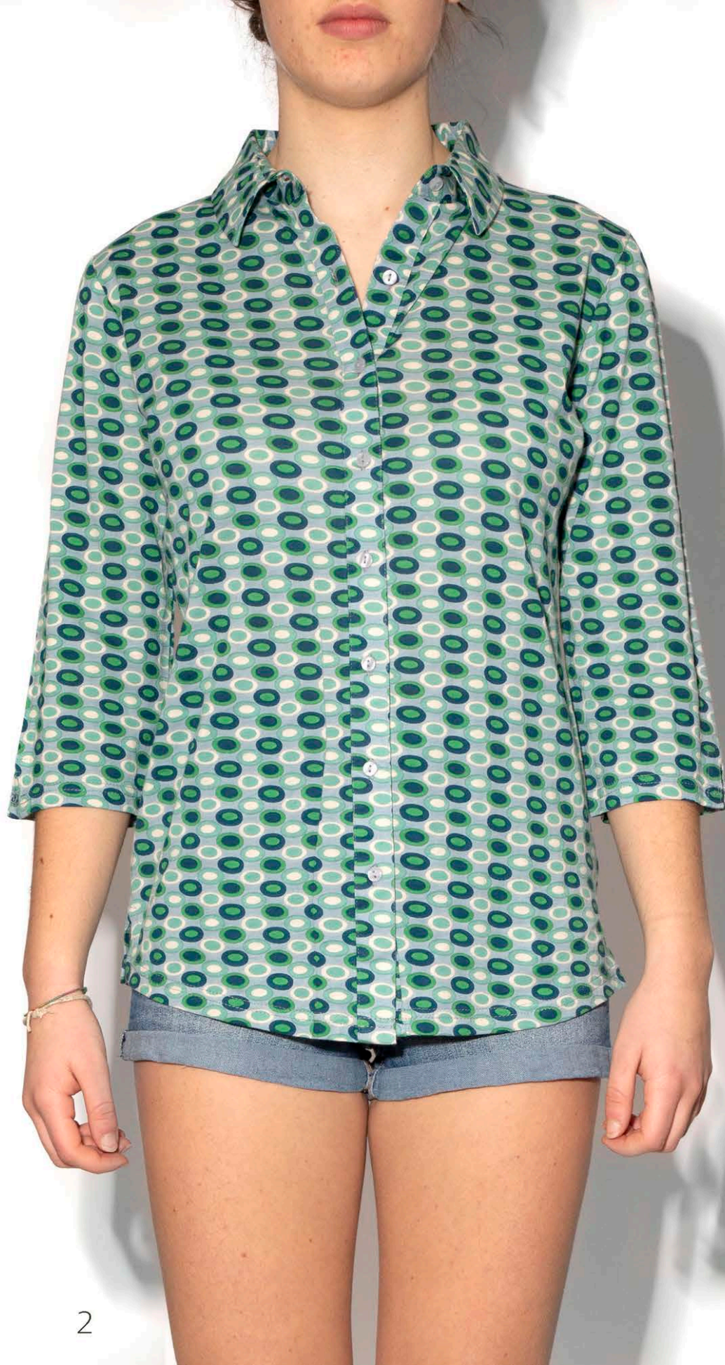
S 335 Camicia Jersey Ovali - 100% Cotone - s-m-l-xl