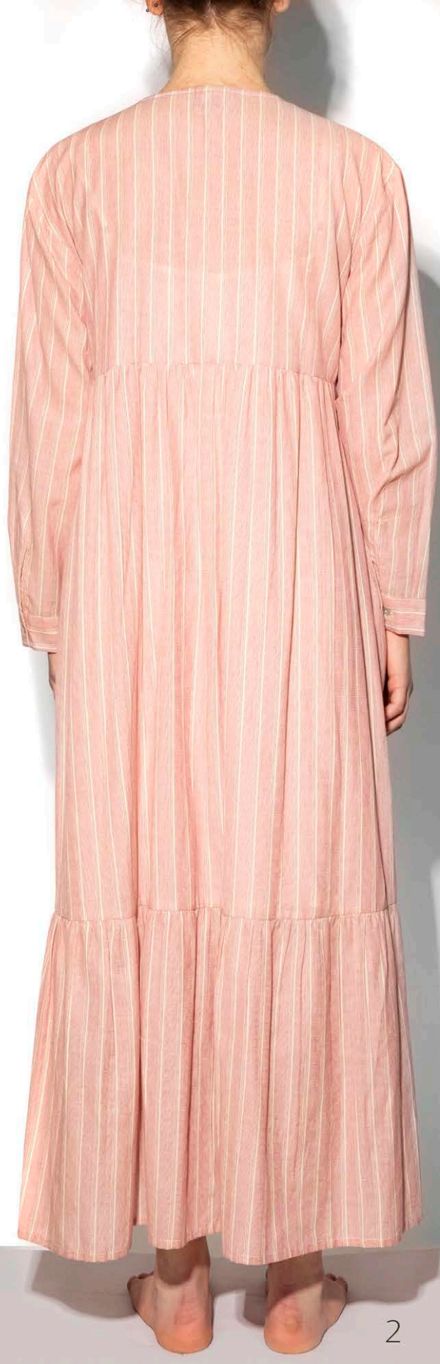
S 33 Gather Dress Tinto in Filo - 100% Cotone - s-m-l-xl