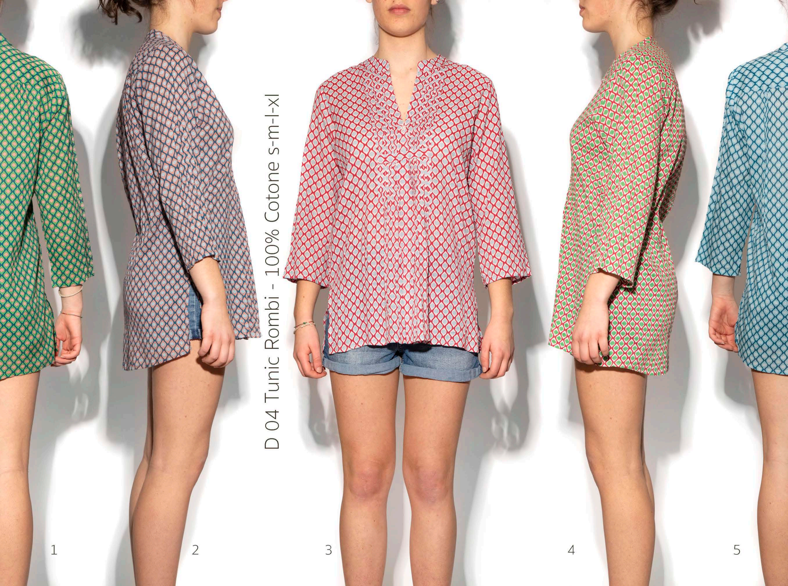
D 04 Tunic Rombi - 100% Cotone s-m-l-xl