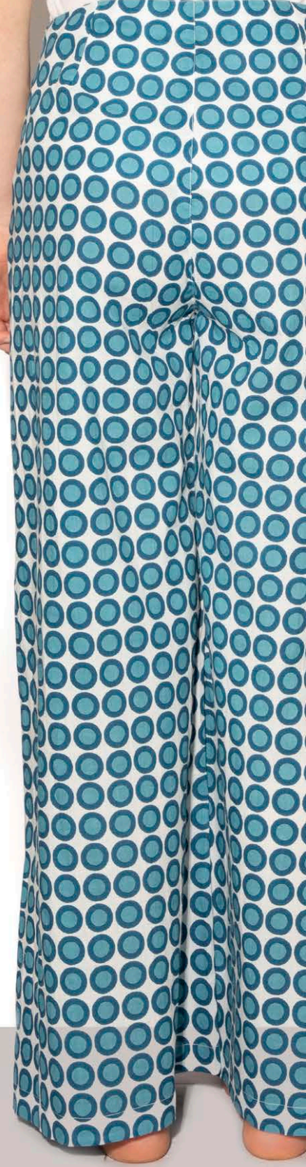
S 346 Panta Largo Cerchio - 100% Cotone - s-m-l-xl