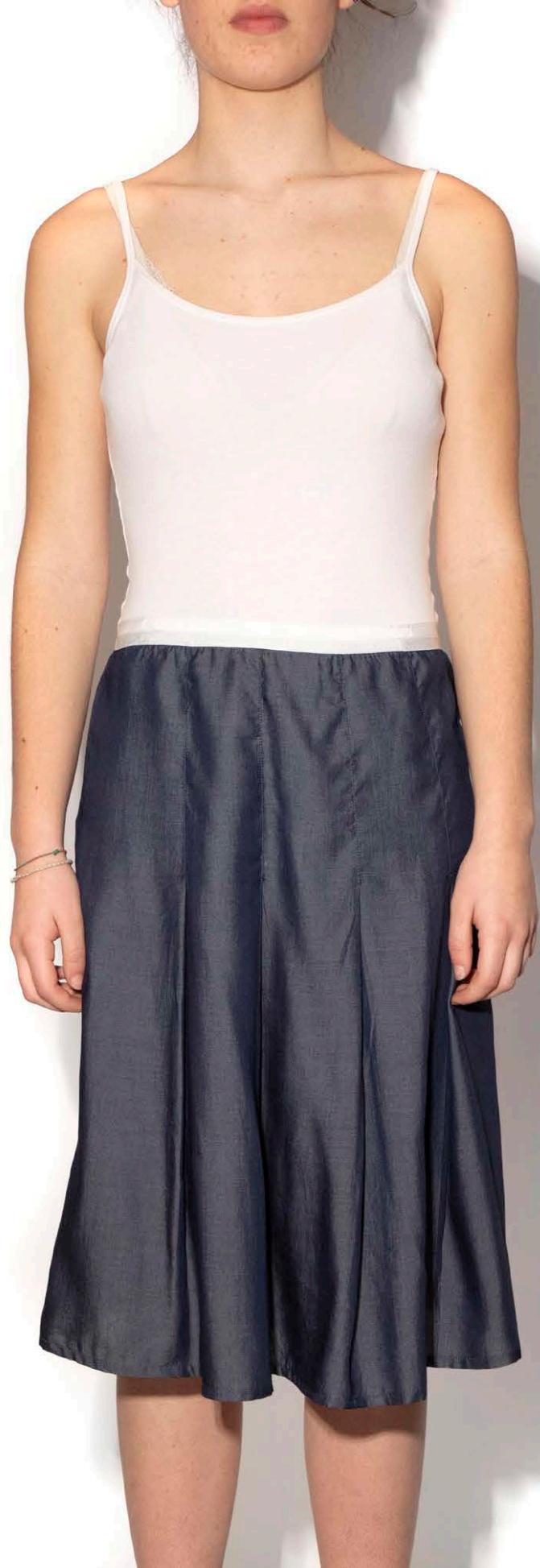
S 381 Gonna Jeans - Viscosa - s-m-l-xl